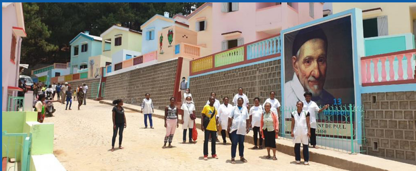
Proyecto de la Campaña "13 Casas" en Akamasoa, Madagascar